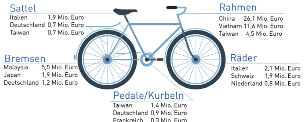
Woher Fahrräder kommen

der im Jahr 2020 in Österreich produzierten Fahrräder wurden exportiert